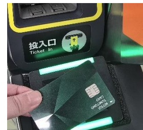
出場時に専用リーダーにかざす