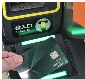
入場時に専用リーダーにかざす

タッチ決済に対応のカード(クレジットカード・デビット・プリペイド)や、同カードが設定されたスマートフォン等を自動改札機に設置された専用のリーダーにかざすことで、地下鉄にご乗車いただくことができます。