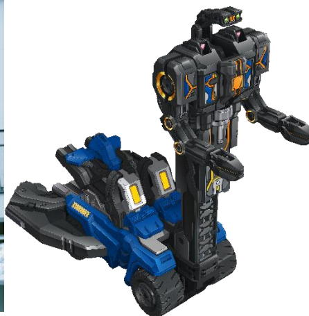
シンカリオンCWに登場する エルダ式ジンキ