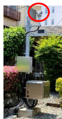
地上無線機アンテナ（赤丸部）