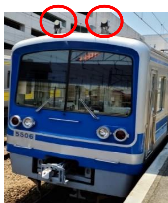
車上無線機アンテナ（赤丸部）