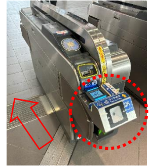
（出場時に対応改札機にタッチ）