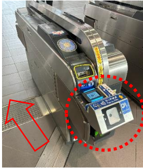
（入場時に対応改札機にタッチ）