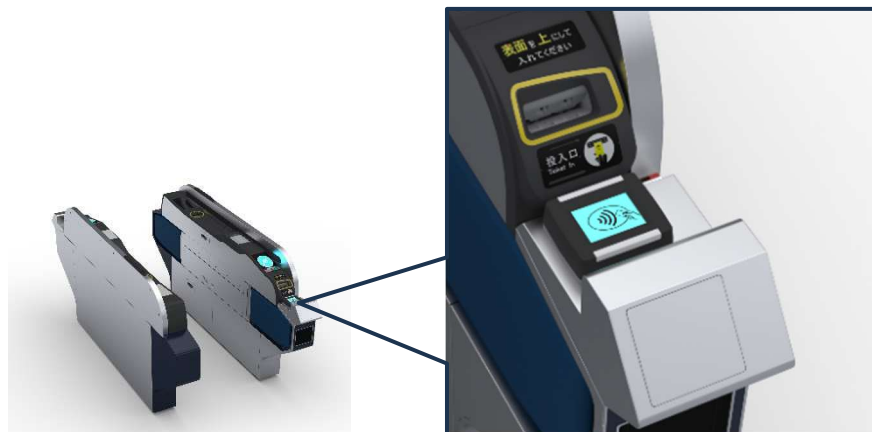
【自動改札機のイメージ】

実証実験の開始にあたり、札幌市営地下鉄全46駅の一部自動改札機にタッチ決済読取部を搭載します。