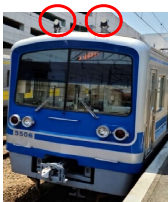
車上無線機アンテナ（赤丸部）