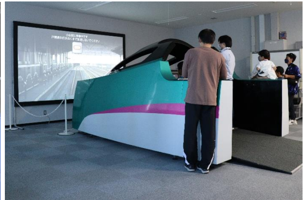
運転シミュレータ体験