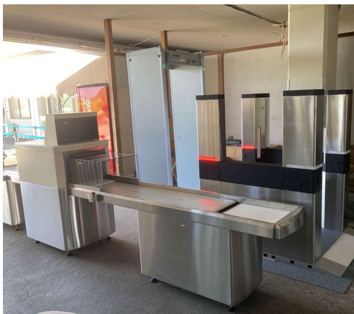
写真前方：X線手荷物検査装置

今後もX線手荷物検査装置の機能充実、ボディスキャナの開発推進に努めてまいります。