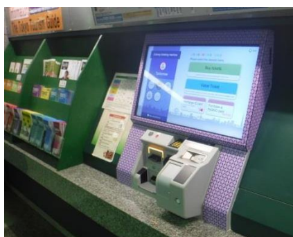
運用開始後の様子

2017年2月21日から都営地下鉄大江戸線都庁前駅で運用開始しており、2017年3月までに計31駅へ順次納入いたします。