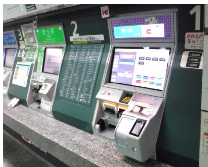
運用開始後の様子

2017年2月1日から都営地下鉄大江戸線都庁前駅で運用開始しており、2019年3月までに計106駅へ順次納入いたします。