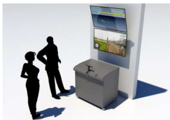
SPARCS シミュレータ イメージ