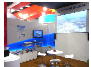
InnoTrans 2012 当社ブース