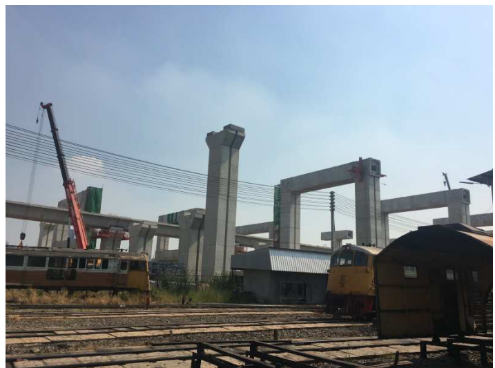
バンコクレッドライン建設現場の様子