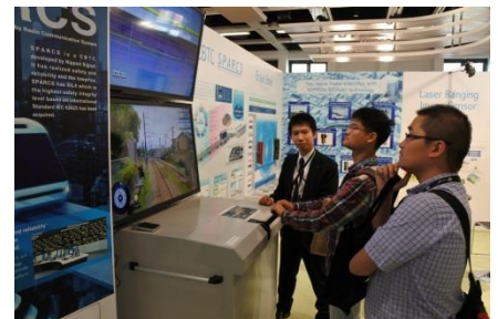
SPARCS 運転シミュレーター体験