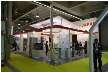
UITP 2015 当社ブース